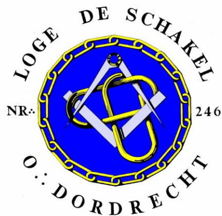
Vrijmetselaarsloge "De Schakel" te Dordrecht