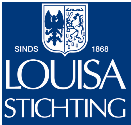
Vrijmetselaarsstichting "Louisa Stichting"