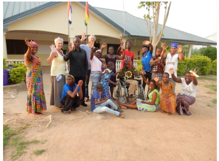
Afscheid in Offinso, maart 2017