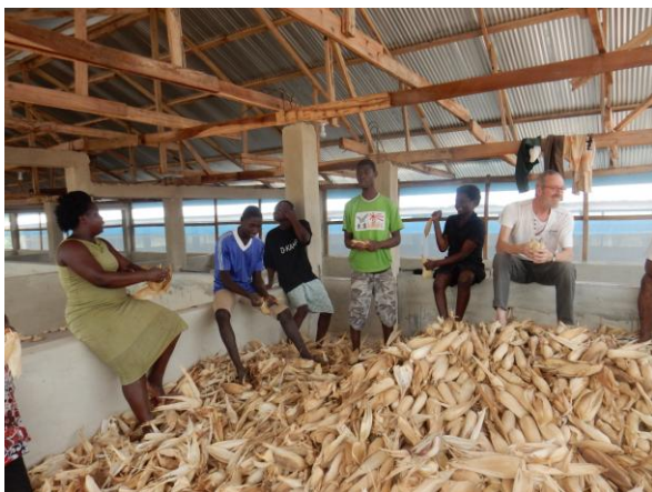
Werken met maïs in 2017