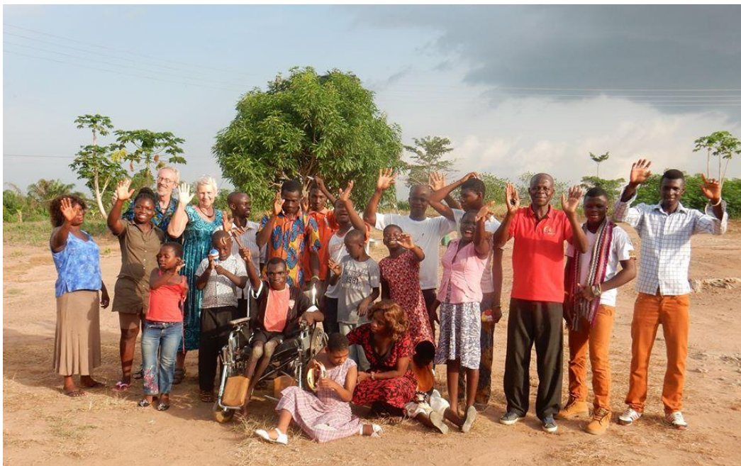
Offinso: afscheid in mei 2016