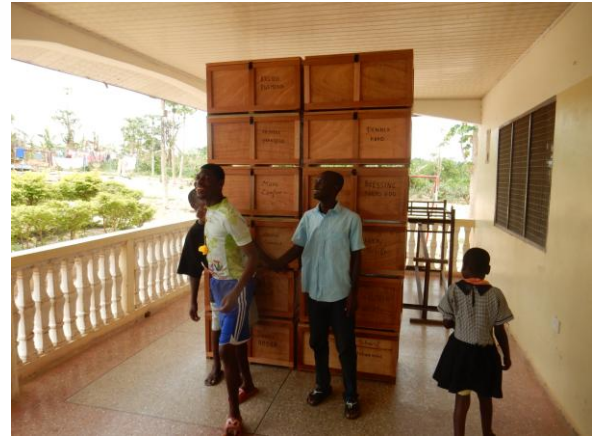
Nieuwe kledingkasten in maart 2017